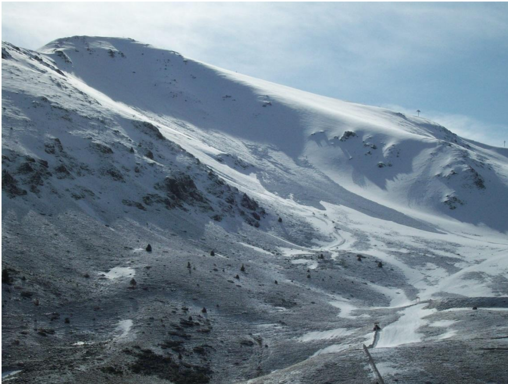
Activitat d'allaus de les precipitacions de l'inici de setmana a Boí.