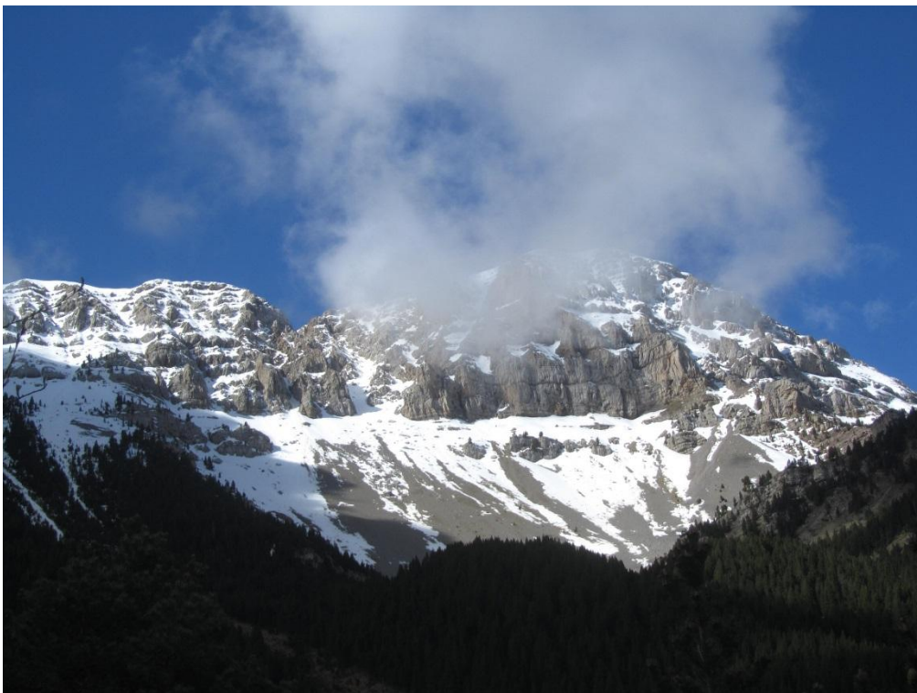
Mantell discontinu de finals de setmana al Cadí.