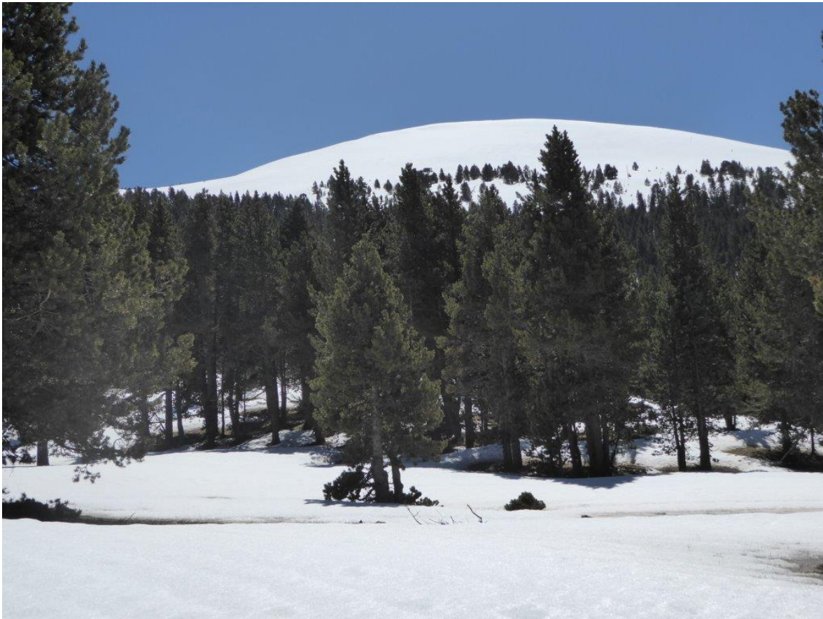
La Tossa Pelada (Prepirineo) luce un manto continuo el martes 26 de abril en orientaciones norte por encima de 2000 m.