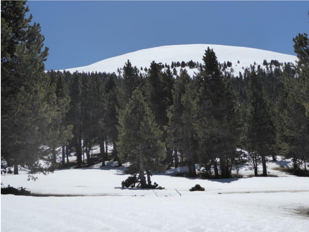
La Tossa Pelada (Prepirineu) amb un mantell continu el dimarts 26 d'abril en orientacions nord per damunt de 2000 m.