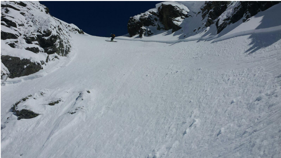
Allau de placa friable o tova a partir de la nevada amb vent de diumenge, provocada el dilluns 25 d'abril, al sector Mariola-Port de Tavascan (Franja Nord de la Pallaresa).