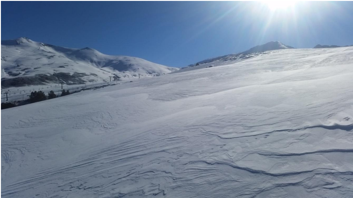
Mantell format per neu seca ventada en superfície el dilluns 25 d'abril a l'Aran, conseqüència de la glopada de temps hivernal del diumenge 24 d'abril.