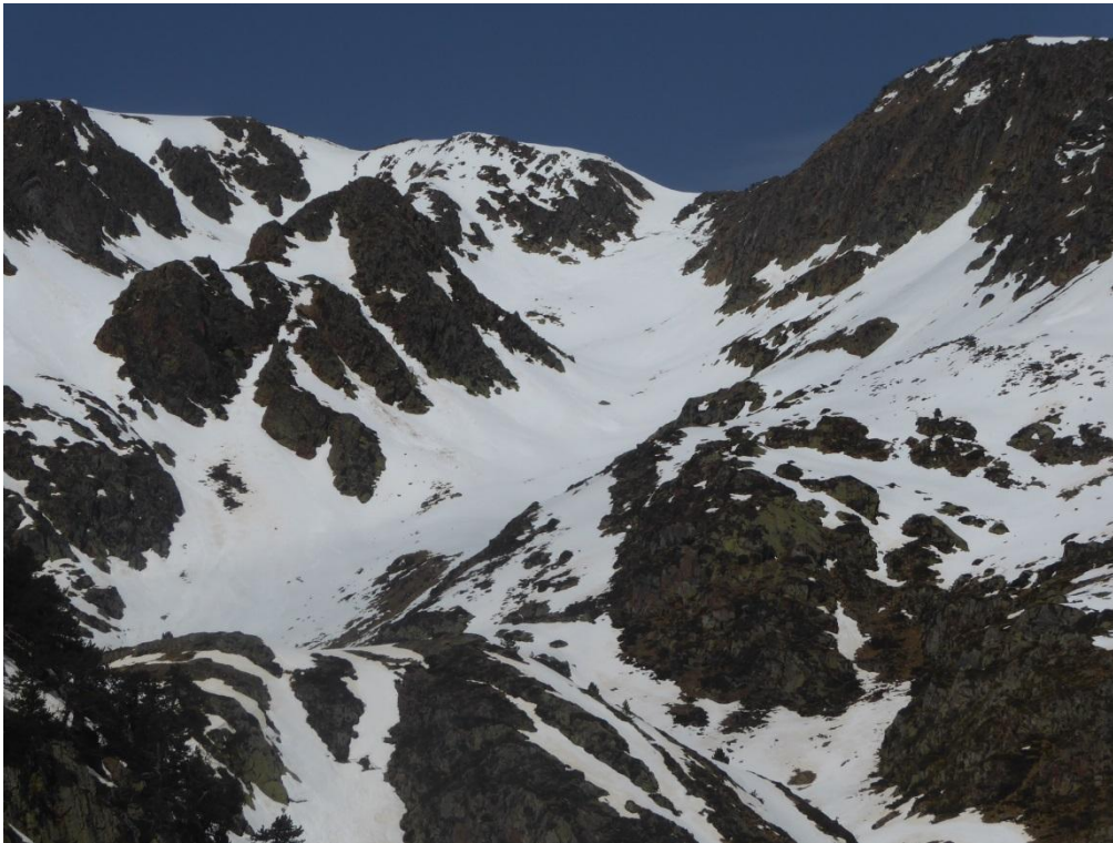
Manto húmedo y purgas caídas en el Norte de la Pallaresa a inicios de semana.