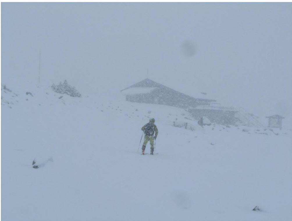
Nevadas del jueves en el Ter-Freser.