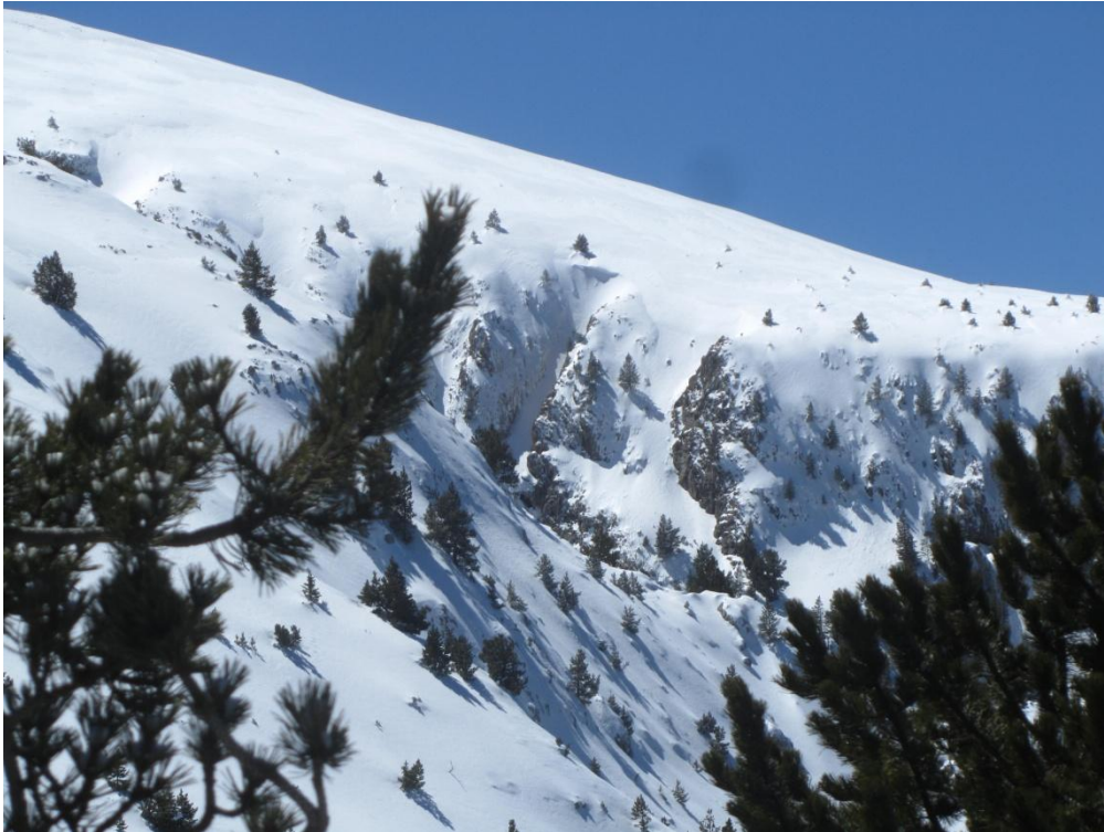
Aspecte de les canals al Moixeró (Vessant Nord Cadí-Moixeró) el dilluns 11 d'abril. Mantell homogeni ben distribuït.