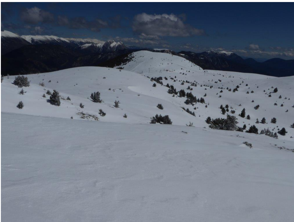
Aspecte del sector Port del Comte-Tuixén el dilluns 11 d'abril, amb el vessant sud de la serra del Cadí i el Pedraforca ben innivats. Probablement aquesta setmana haurà estat el pic d'innivació al Prepirineu en tota la temporada.