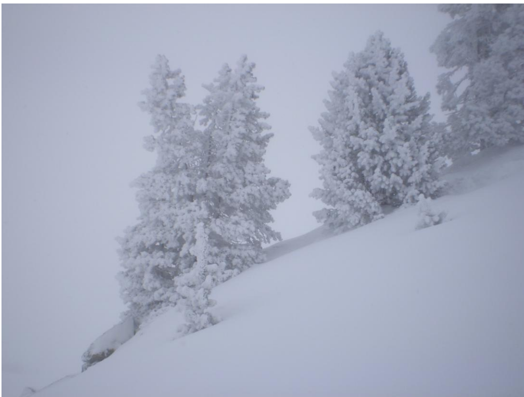
Situació de finals de setmana amb les nevades a la vessant nord.