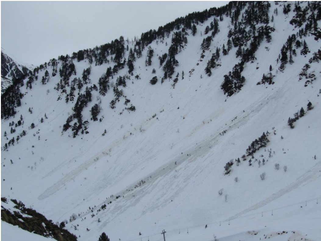
Purgues caigudes al Nord de la Pallaresa a inicis de setmana.