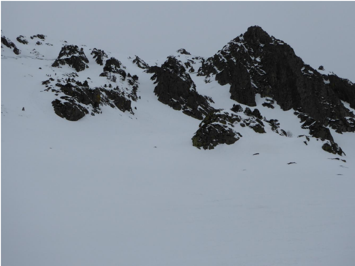
Ambiente húmedo por la lluvia y nubes bajas en el sector de Tavascan el viernes día 25, que se da en todos los sectores.