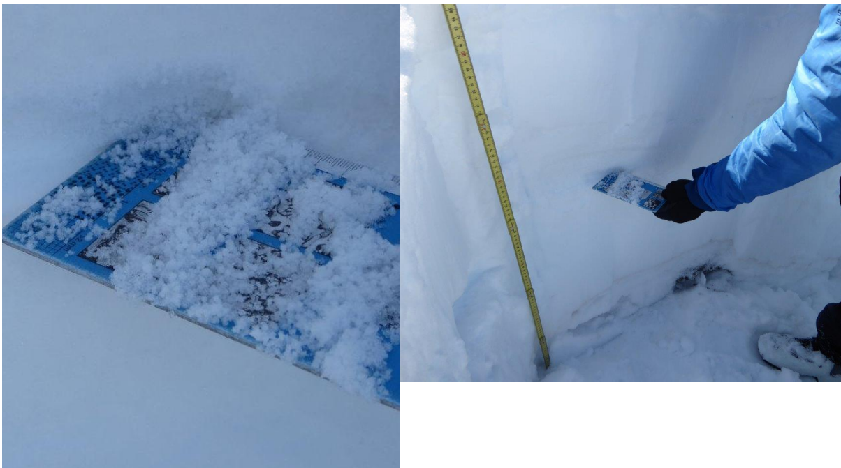
Fotografías de la nieve granulada que aún se conserva en las zonas umbrías. En este caso en las canales del Cadí.