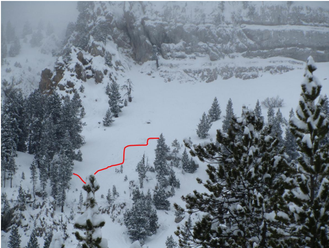
Allau de placa a les canals del Cadí (Vessant Nord Cadí-Moixeró), observada el dijous 17, a partir de la nevada d'aquella mateixa matinada.