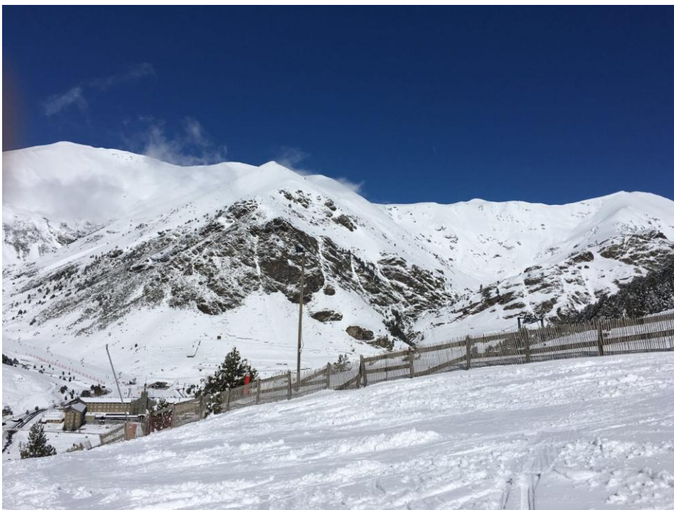
Mantell ben distribuït al Pirineu oriental (Ter-Freser), amb la nevada del diumenge 20 de març.