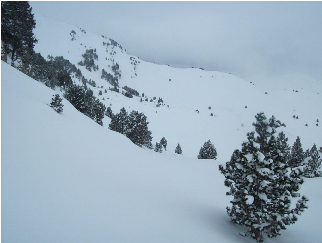
Manto homogéneo en el centro del Aran al inicio de la semana.