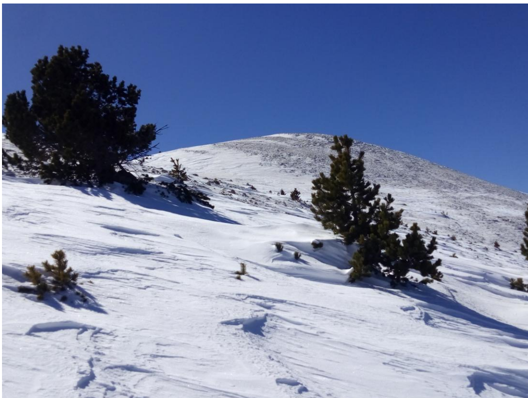
Mantell molt ventat i deflactat al Prepirineu a finals de setmana.