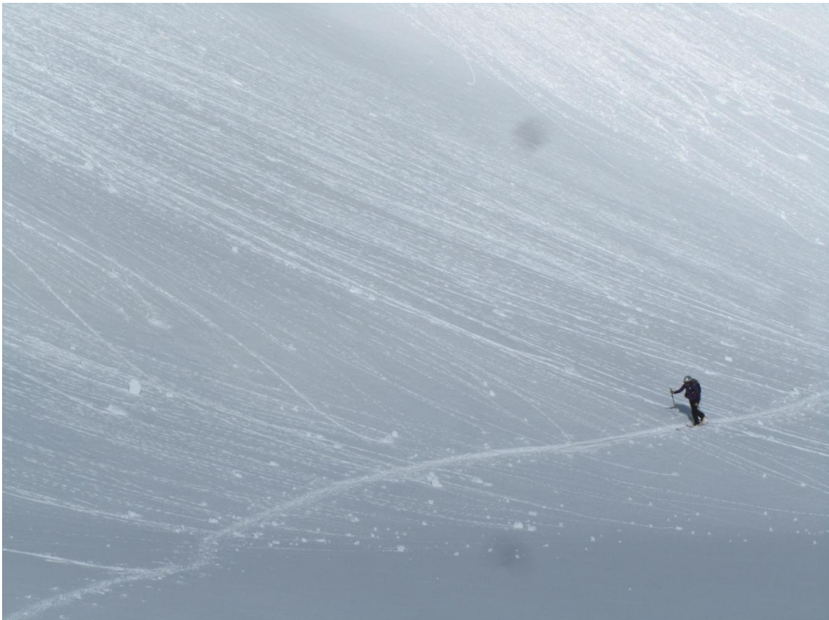
Caída de bolas de nieve húmeda en la Franja Norte de la Pallaresa. Se han dado en momentos de tregua de las nevadas debido a la insolación que ya empieza a tener efecto sobre la nieve durante el mes de marzo.