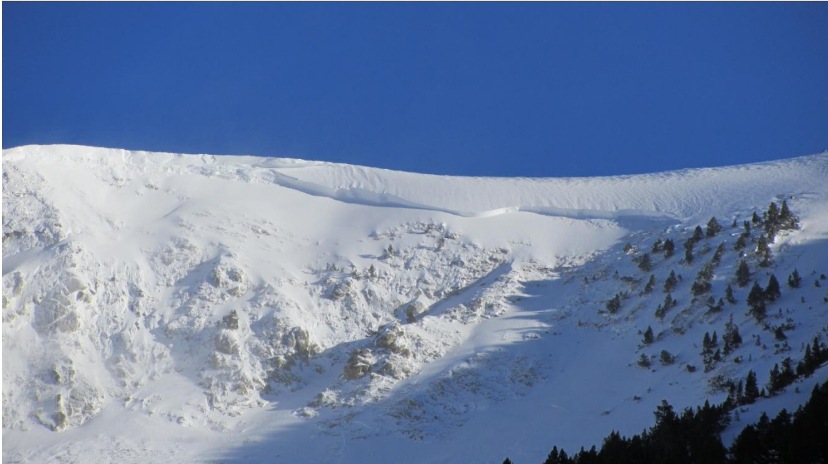
Imagen de la alud caído en el sector de Ulldeter al inicio de la semana en una ladera orientada al sur.