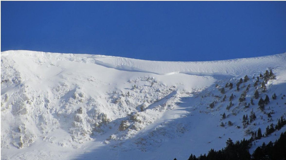
Imatge de l'allau caiguda al sector d'Ulldeter a l'inici de la setmana en un vessant orientat al sud.