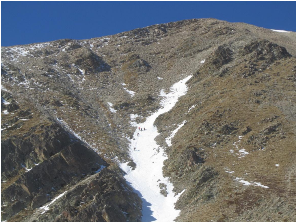
La situació més anòmala en quant a dèficit de neu al terra es troba a l'extrem més oriental del Pirineu oriental, cara sud del pic de Bastiments (Ter-Freser) el dimecres 27 de gener.