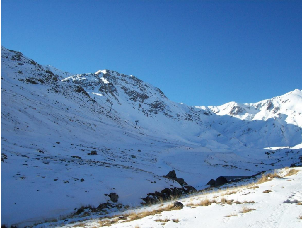
Mantell molt prim a la Ribagorçana-Vall Fosca el dimecres 27 de gener, fins a cotes altes.