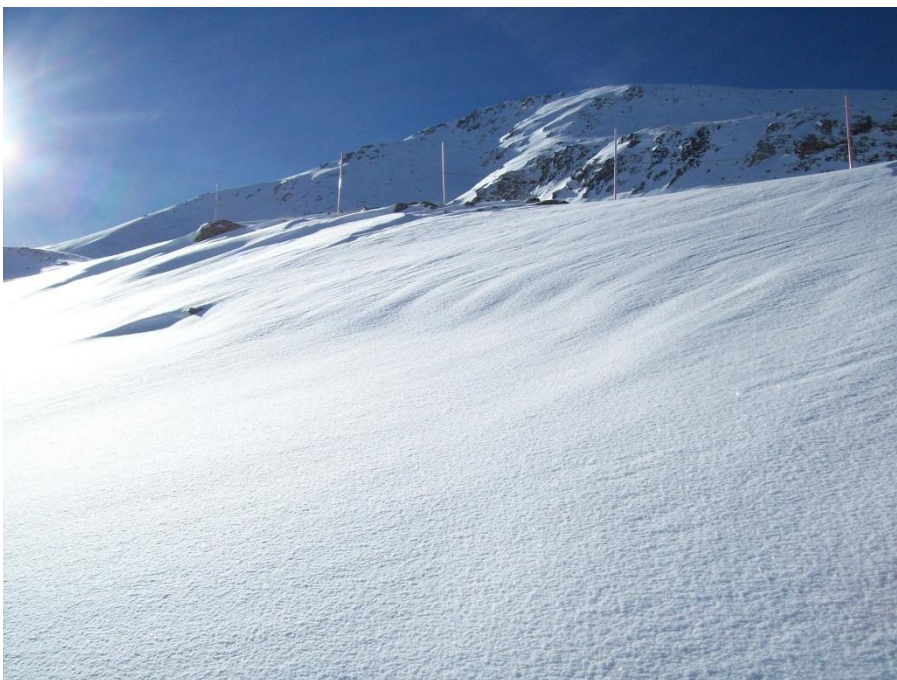
Situació de neu recent i neu ventada al sector de la Ribagorçana-Vall Fosca.