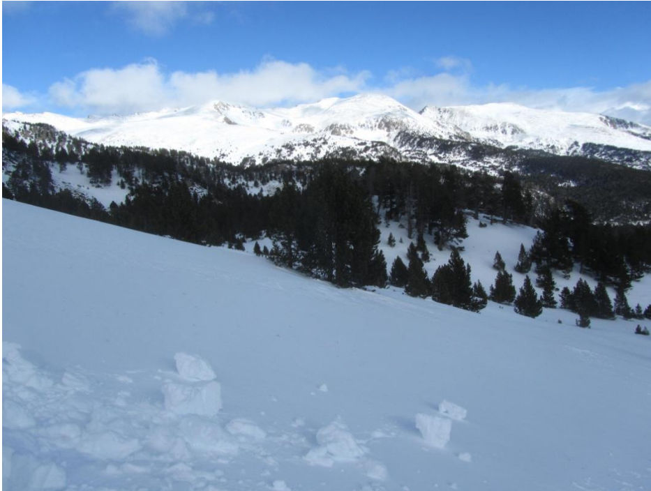
Aspecte del mantell nival al sector del Perafita-Puigpedrós