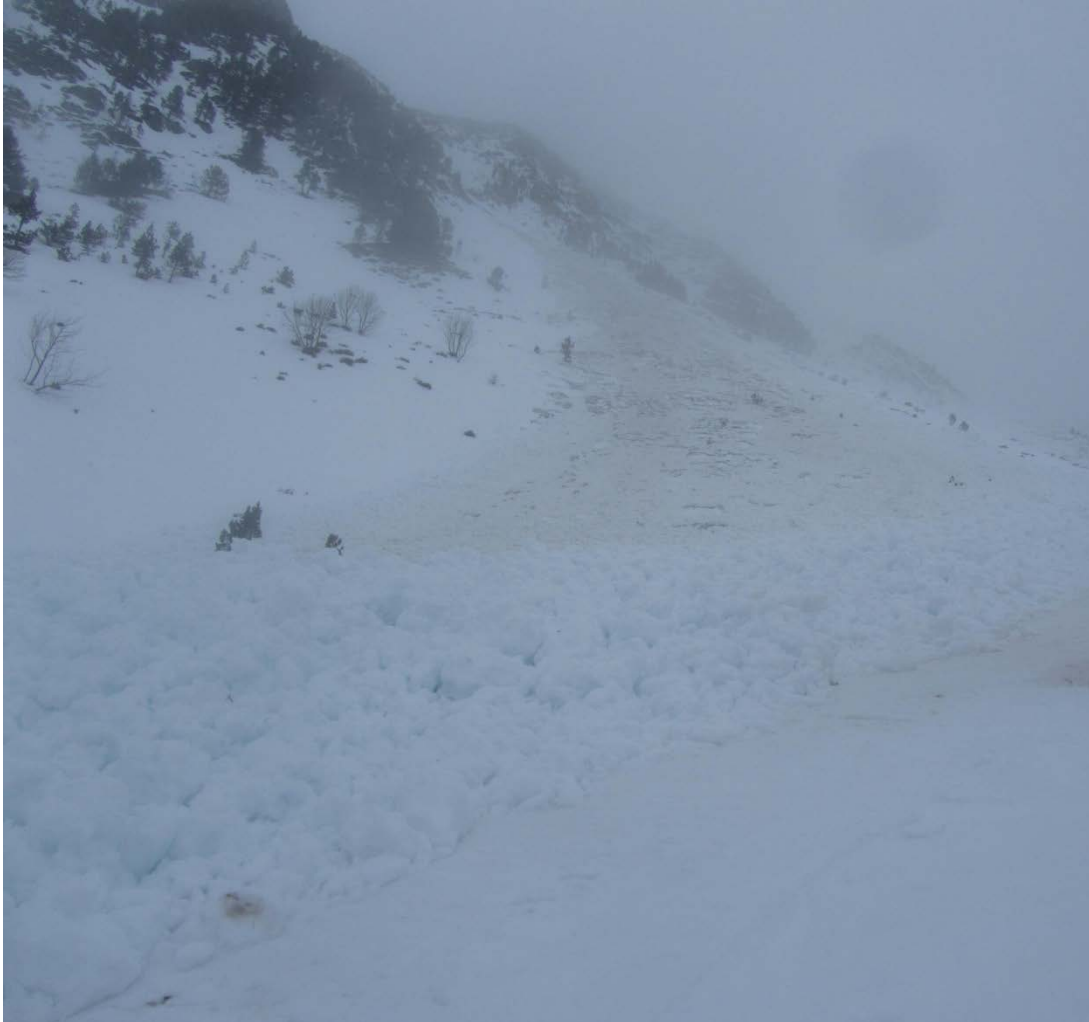
Imatge d'una allau de fusió ocorreguda entre divendres nit i dissabte matí a la Franja Nord de la Pallaresa.