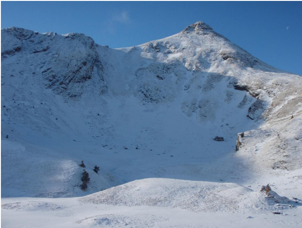
Fora de l'Aran-Franja Nord de la Pallaresa, el mantell no és continu i es redueix a enfarinades directament damunt del terra, que marxem en un parell de dies de temps assolellat (Pallaresa, divendres 2 de gener de 2016).