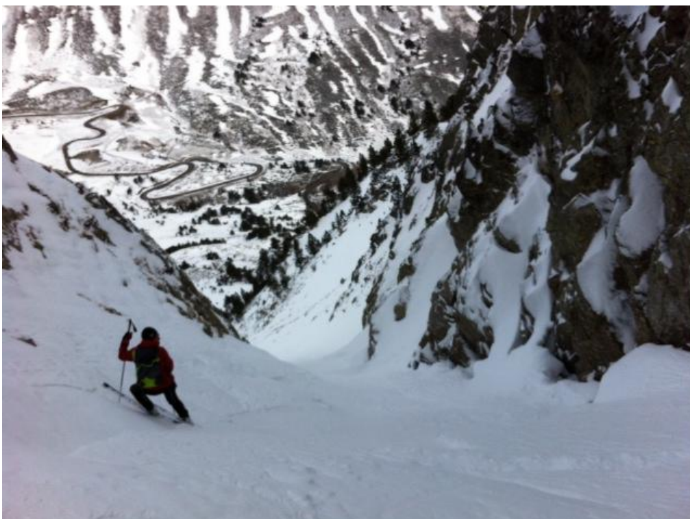
Allau petita de neu ventada (mida 1) produïda al pas d'un esquiador en una canal de fort pendent orientada al nord-est (Bonaigua, Aran-Franja Nord de la Pallaresa, diumenge 3 de gener de 2016).