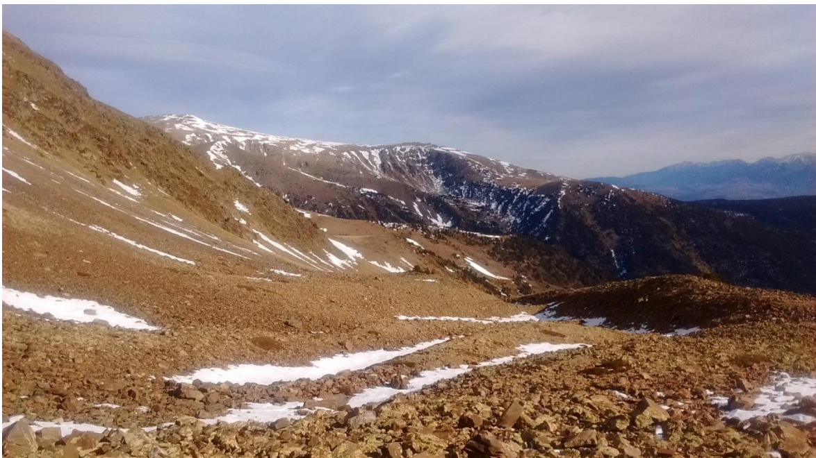
Mantell quasi inexistent o molt restringit sota colls i carenes (Perafita-Puigpedrós, dijous 24 de desembre).