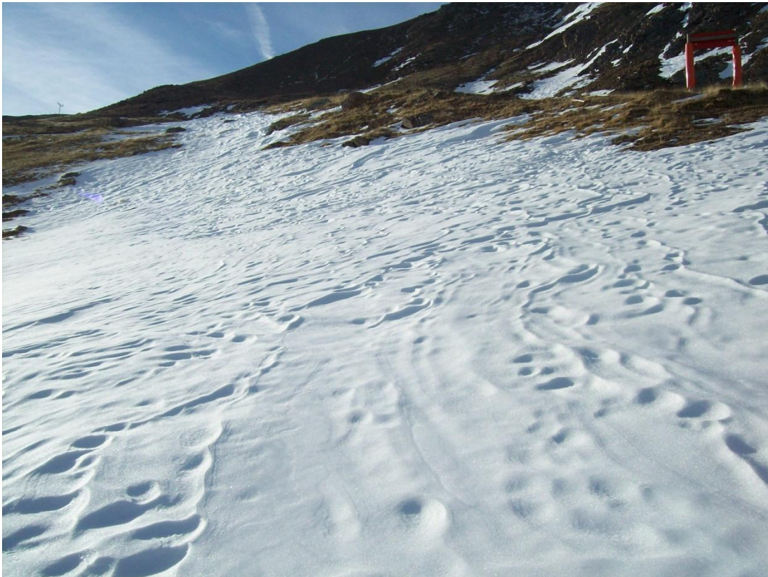
Mantell molt endurit format per neus ventades que després s'han encrostat donant lloc a crostes de vent relliscoses en vessants assolellats (Ribagorçana, dijous 24 de desembre).