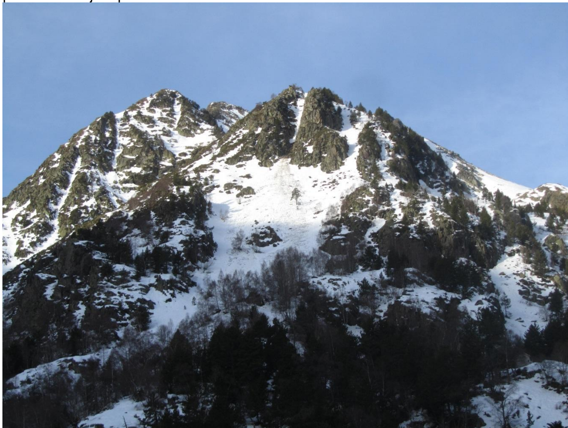
Purgas de fusión en pendientes fuertemente inclinadas en la Franja Norte de la Pallaresa.

Perspectivas. Seguimos sin cambios de cara a la semana siguiente. A principios de semana se mantendrá todavía la situación de fusión, pero con el cielo raso de noche se prevé una mejora por el rehielo nocturno.