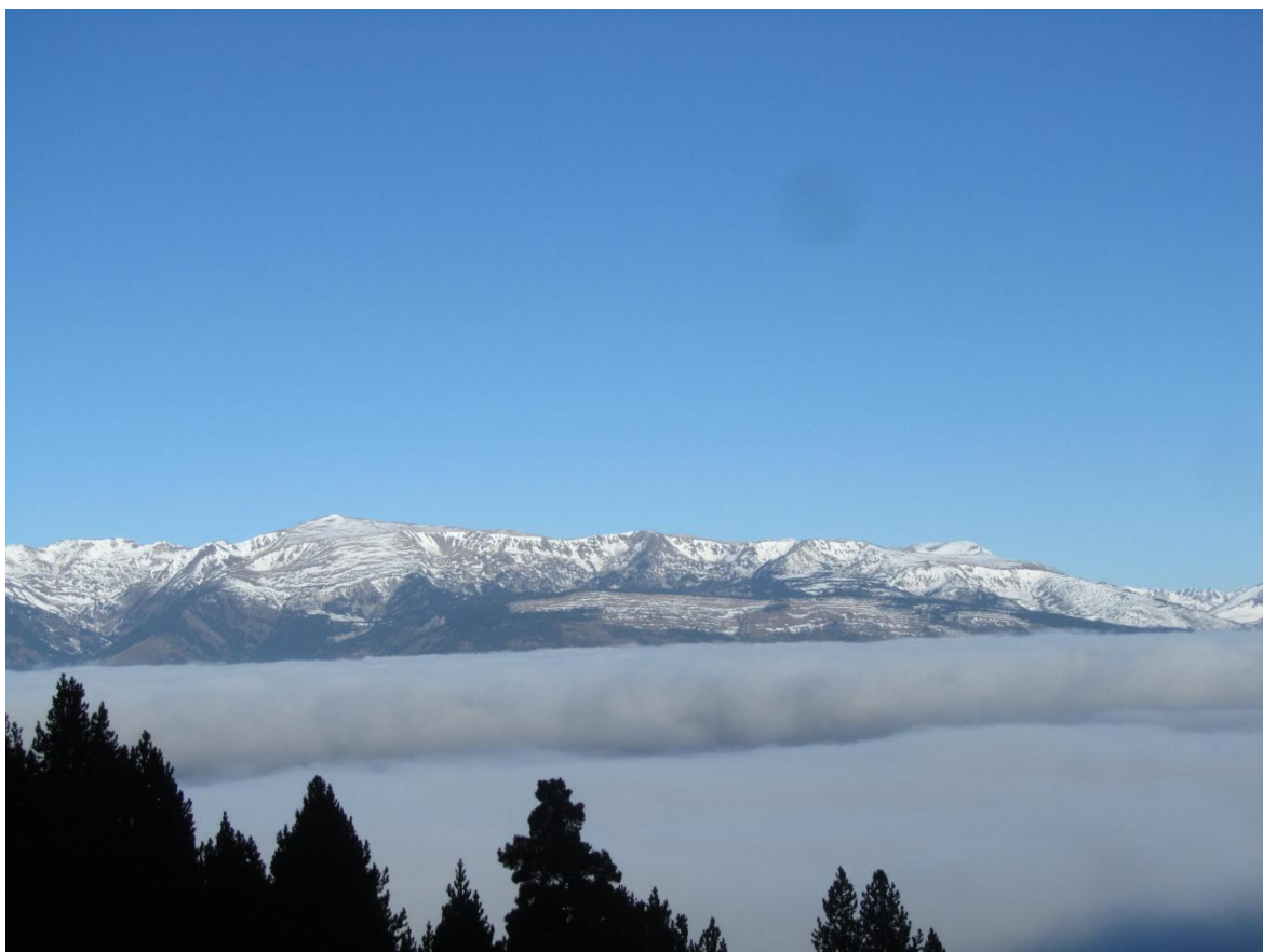
Situació típicament anticiclònica des del Bosc de les Pedrusques (Masella), amb boira a la plana ceretana i temps assolat a cotes mitges i altes.

Perspectives. No es preveuen massa canvis de cara a la setmana següent. La situació anticiclònica sembla molt assentada i les febles precipitacions que mostren alguns models no semblen massa fiables.