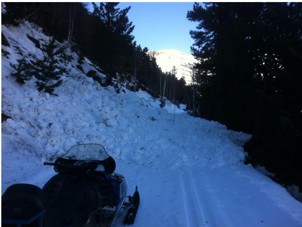
Imatge dels dipòsit del lliscament a la obaga del dia 5/12/2015 a la Franja Nord de la Pallaresa.

Perspectives. Per la setmana actual (del 7 al 13 de desembre) no es preveuen nevades i l'anticicló es mantindrà centrat sobre la península Ibèrica. Continuarà el procés de formació de neu pols reciclada a les obagues i neu compactada a les solanes amb lleu fusió superficial durant els dies assolats i d'altres temperatures però que tornarà a encrostar-se pel refredament nocturn.