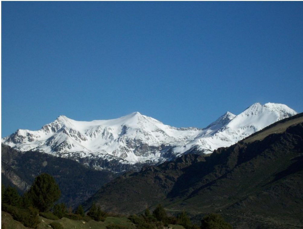
Vista de la part nord de la Ribagorçana, Parc Nacional d'Aigüestortes i Estany de Sant Maurici, el dimarts 28 d'abril. Les pales orientades a sud i a cotes altes encara estan ben carregades de neu ventada de les darreres nevades d'abril.