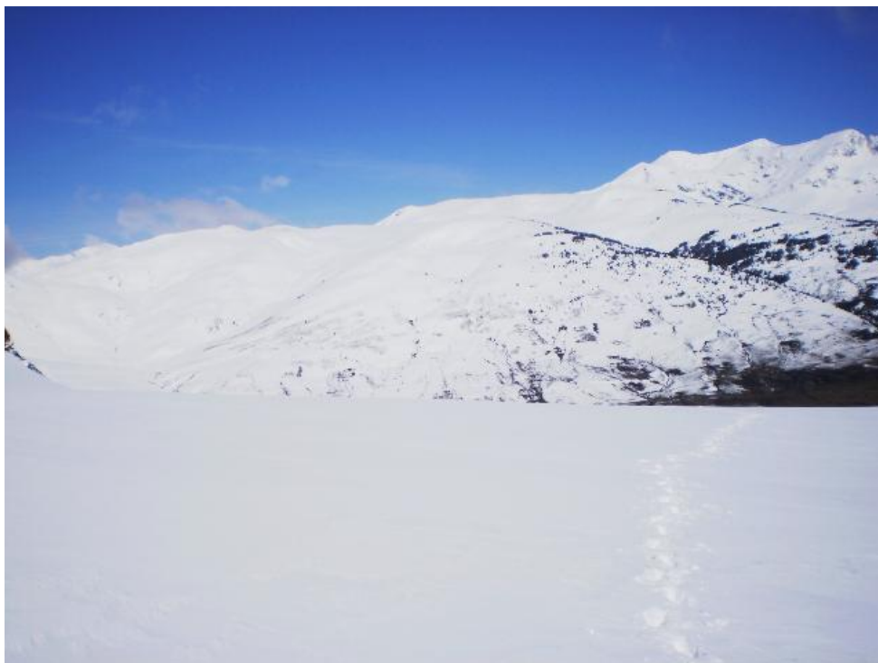
Vista del sector de Beret, a l'Aran, el dimarts 28 d'abril després de la nevada de dilluns.

El perill d'allaus es mantenia en FEBLE (1) ja que la neu estava molt ben assentada internament, densa i compacta, amb lleugera inestabilitat superficial degut a la neu recent que ràpidament es transforma en gra de fusió i dona lloc a purgues puntuals. Localment el perill puja a MODERAT (2) al centre del dia. Al Cadí-Moixeró i al Prepirineu l'escassetat de neu va fer que ja no s'emetés grau de perill d'allaus.