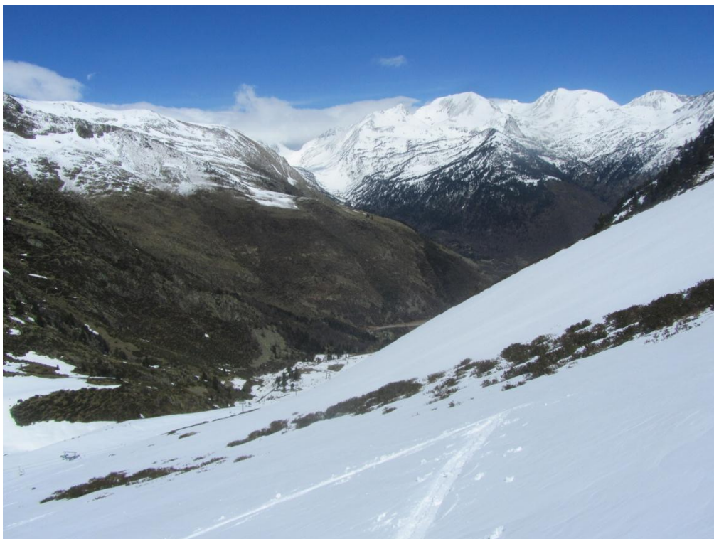
Es manté la neu recent sobre la neu vella, mentre que la que va caure damunt del terra ràpidament es fon (Tavascan-Franja Nord de la Pallaresa), dimarts 28 d'abril.