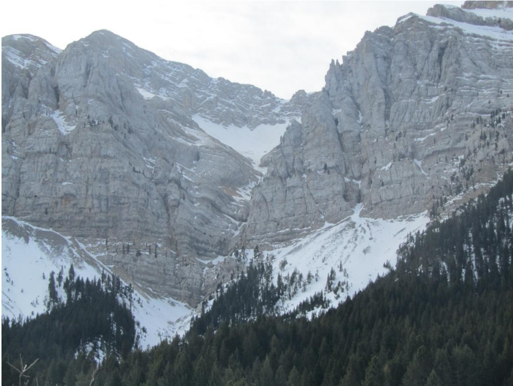
Aspecte de les canals del Cadí, dimarts 10 de març, molt pobres de neu, en un hivern que està mantenint aquest sector amb una innivació molt per sota de la normal.