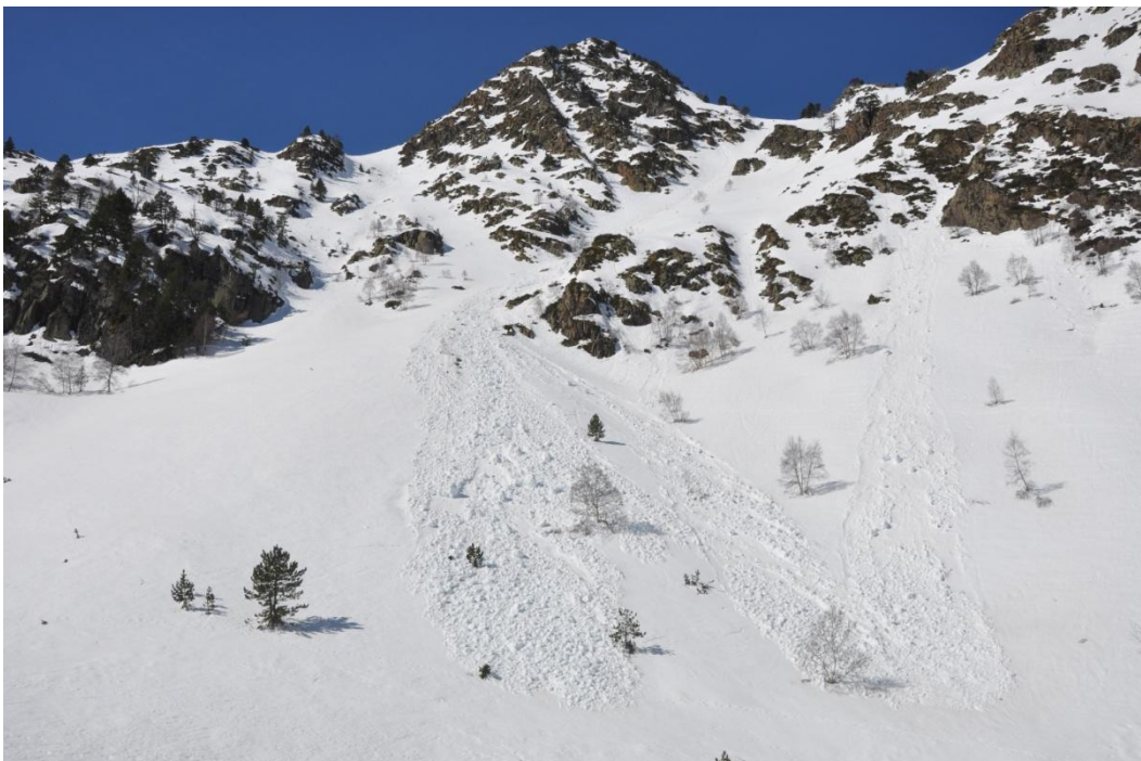
Purgues i allaus petites (mides entre 1 i 2) de neu humida en vessants assolellats durant els primers dies de la setmana (imatge del dimecres 11 de març, Franja Nord de la Pallaresa).