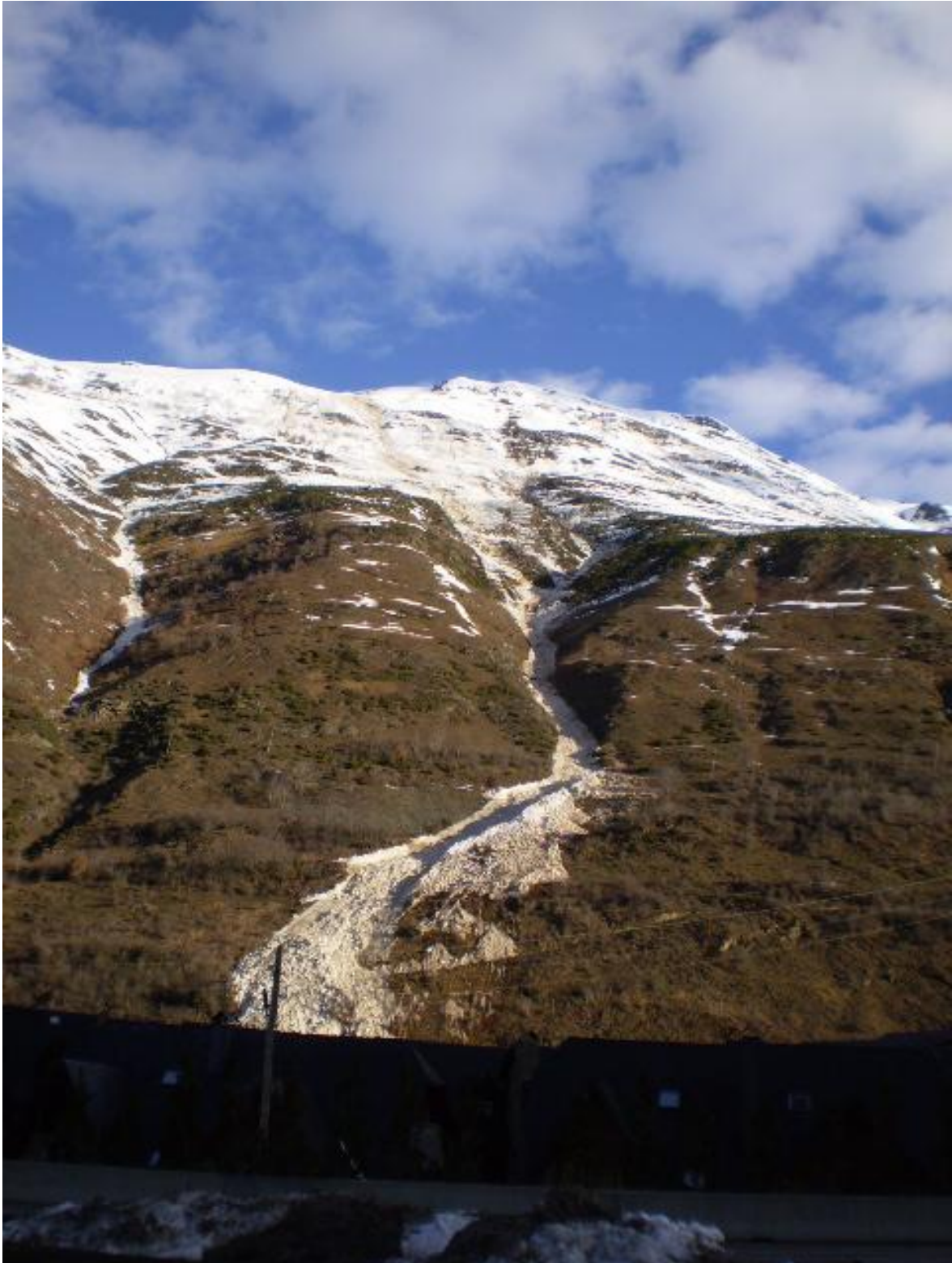
Allau de lliscament caiguda el dilluns 2 de març a migdia, a l'Aran, degut al fort humitejament del mantell que va començar el cap de setmana amb les pluges. El feble regel dels dies posteriors només és superficial.