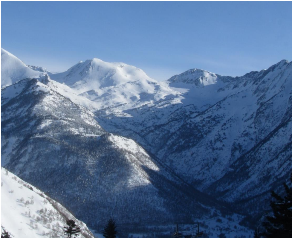
Imatge de la cara sud del Pic de Certascan carregat amb les nevades. Imatge presa el divendres 6 de febrer amb el cel ja clar després de tota la setmana amb cel cobert i nevades.