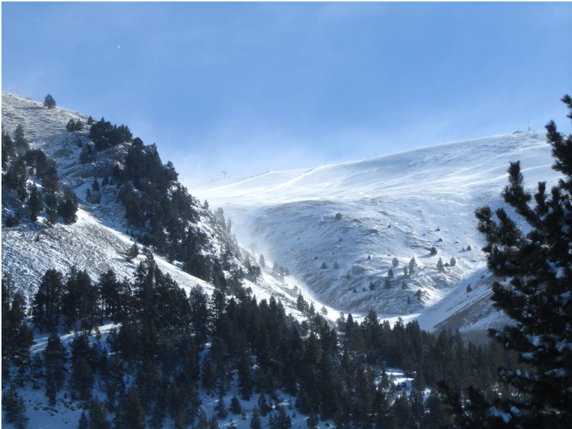
Imatge presa el dijous dia 5 de febrer al sector Vessant nord del Cadí Moixeró afectat pel del torb i les deflacions produïdes pel vent.