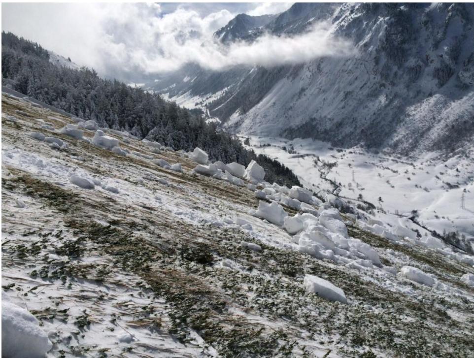
Allau de placa de fons a la vall de Ruda, caiguda el dijous 5/2/2015.