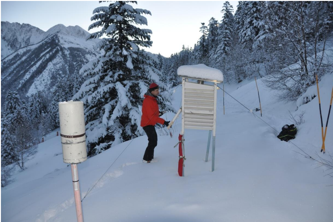
Aspecte de la nevada seca i freda de divendres 16-dissabte 17 de gener a Tavascan (Franja Nord de la Pallaresa).