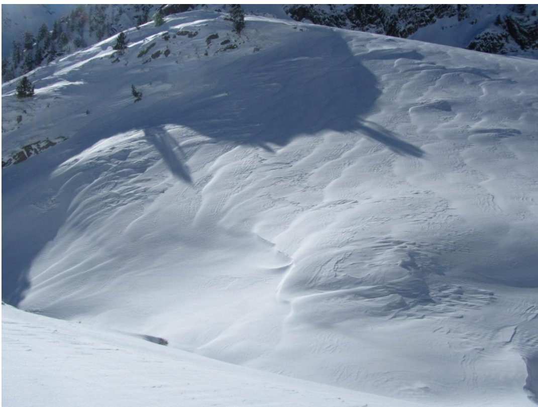
Plaques de vent toves formades en orientacions sud i est (Franja Nord de la Pallaresa) durant el dissabte 17 de gener. Observeu el dibuix del vent en forma de dunes sobre la neu (vent de dreta a esquerra), que indica l'existència de plaques de vent toves o friables.