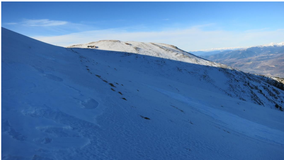
Imatge del dimarts 23 de desembre cap a la Tossa d'Alp (vessant Nord del Cadí-Moixeró). Mantell molt prim, encrostat amb petites clapes de neu ventada.

El dia 28, enmig de la nevada i el vent, un esquiador provoca una petita allau de placa a l'Aran i queda mig colgat, però és rescatat sense conseqüències degut a què són visibles indicis en superfície. També baixen petites allaus de neu recent a la carretera del Port de la Bonaigua, la C-28.