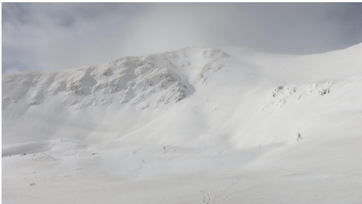
Imatge del dilluns 1 de desembre entre el coll de la Marrana i el Bastiments (Ter-Freser), amb neu ventada en superfície.

Situació del mantell nival. Després de la llevantada de finals de novembre el mantell va passar a ser una crosta marró en superfície, però de gruix important, degut al fang en suspensió provinent del nord d'Àfrica, damunt de la qual s'ha acumulat una fina capa de neu recent humida al principi de la setmana. Gruixos a cotes altes d'entre 50-100 cm a tot el Pirineu excepte a l'Aran-Franja Nord de la Pallaresa on només hi ha una fina capa de neu incohesiva cobrint el terra i al Prepirineu on les nevades només van afectar els cims més alts. El perill d'allaus ha estat baix amb una situació favorable, és a dir, de mantell estable, excepte a cotes molt altes on la situació ha estat de neu ventada, amb algunes petites plaques de vent. Les temperatures baixes han permès la formació de grans amb poca cohesió. Cal veure com s'ha enganxat la nevada amb vent de nord de finals de setmana amb els nivells més vells que hi ha damunt de la crosta. Aquest contacte pot suposar una situació de perill per dies futurs.