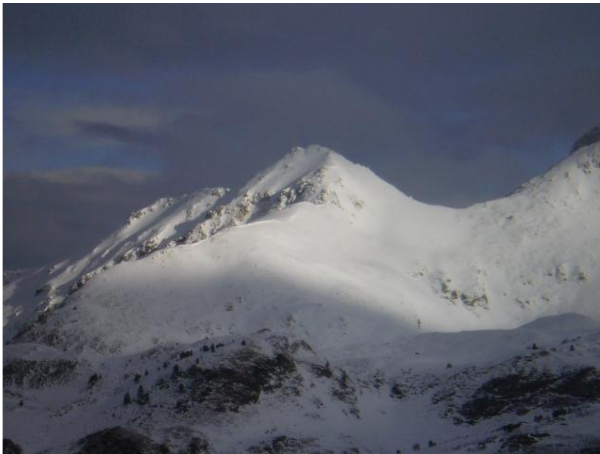
Imatge del divendres 5 de desembre a l'Aran, amb cornises en est i sud, per l'entrada de vents de nord i nord-oest.

Perspectives. Durant l'actual setmana del 8 al 14 de desembre s'alternaran dies anticiclònics amb pas de cues de fronts atlàntics. Les plaques de vent s'aniran densificant i endurint en vessants assolellats, mentre que internament és possible que es vagin formant capes febles de grans facetats. Caldrà anar amb compte amb les plaques de vent.