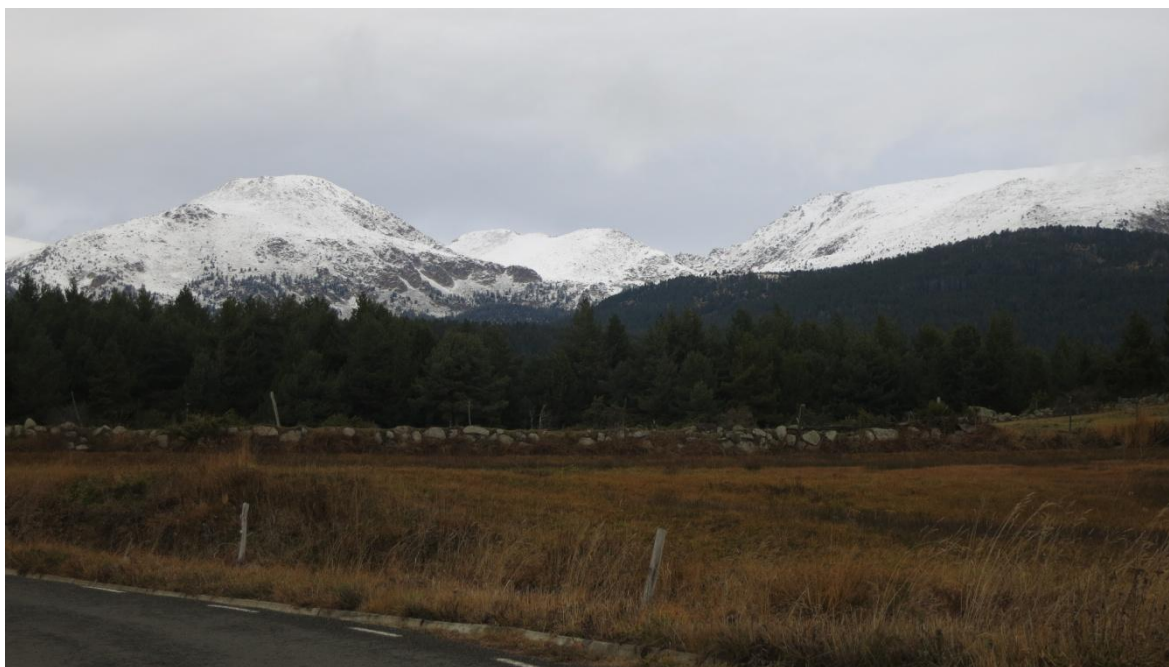
Imagen del jueves 27 de noviembre en el sector Perafita-Puigpedrós.

Situación del manto nivoso. Ha llovido encima del manto viejo, sólo existente previamente en la Ribagorçana-Vall Fosca y en la Pallaresa en cotas altas. Se ha endurecido y rehelado entre 2200 y 2500 m. Encima se han acumulado entre 40-70 cm de nieve reciente húmeda en la Ribagorçana-Vall Fosca y en la Pallaresa. En el resto de sectores la nevada ha caído sobre el suelo, con espesores muy elevados en el Ter-Freser, entre 80-100 cm, entre 10-20 cm en el Aran, mientras que en el Cadí-Moixeró y el Prepirineo las cimas apenas exceden los 2400 m, por lo que sólo han quedado bien nevados los picos más altos. La situación general del manto ha sido de fusión con rehielo, sobre el que ha caído nieve reciente húmeda encima.