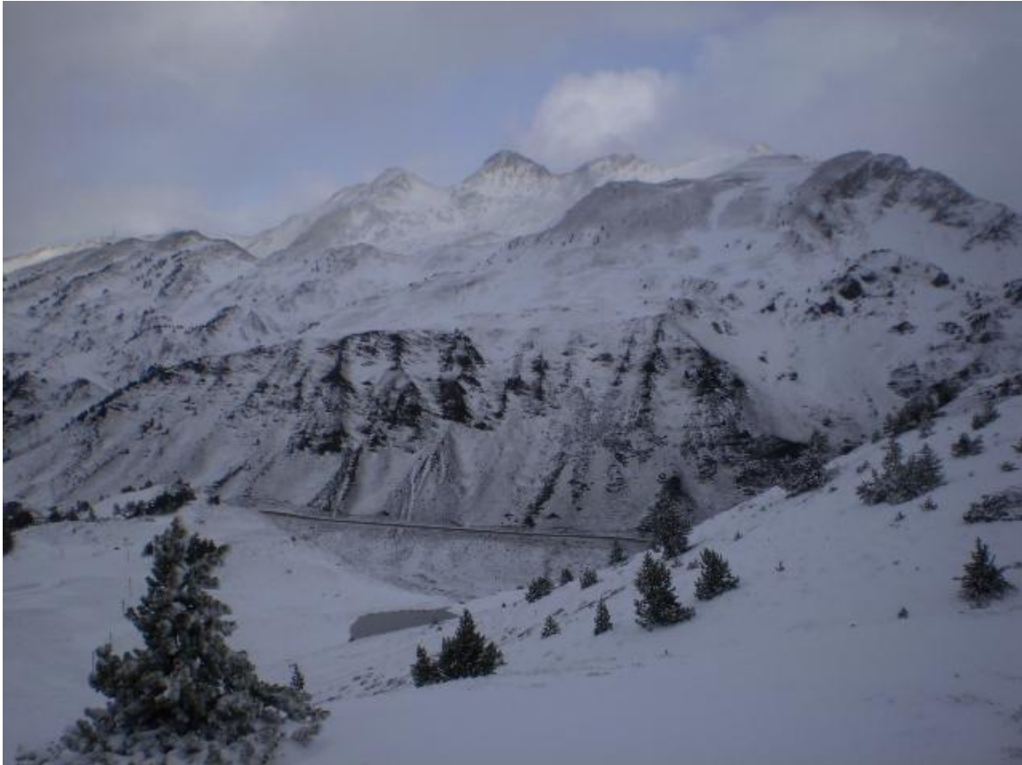
Imagen del viernes 28 de noviembre en el puerto de la Bonaigua, Aran-Franja Norte de la Pallaresa, antes de que lloviera hasta las cumbres.

superior al habitual y se ha llegado a fin de mes con espesores totales de nieve de 50-100 cm a 2500 m.