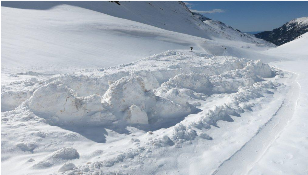
Allau de fusió a la vall d'Eina (Ter-Freser) el dia 3 d'abril de 2014.