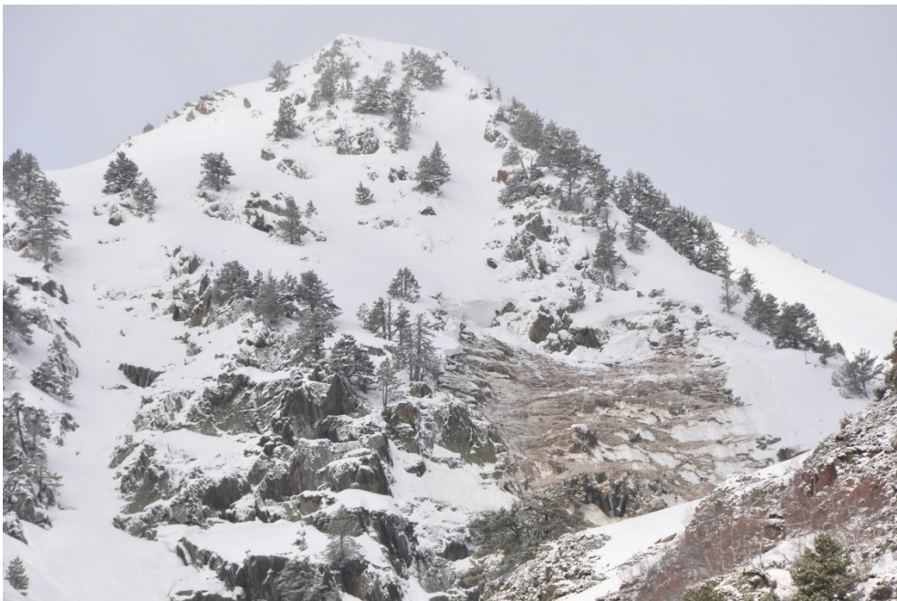
Allau de lliscament caiguda el dia 4 d'abril a Tavascan (Aran-Franja Nord de la Pallaresa). Observeu el gruix del tall en relació als pins del voltant. L'allau no va caure durant la pluja sinó el dia següent, ja que sovint el mantell es manté internament molt humit i fins que no hi ha un refredament notable no s'estabilitza.